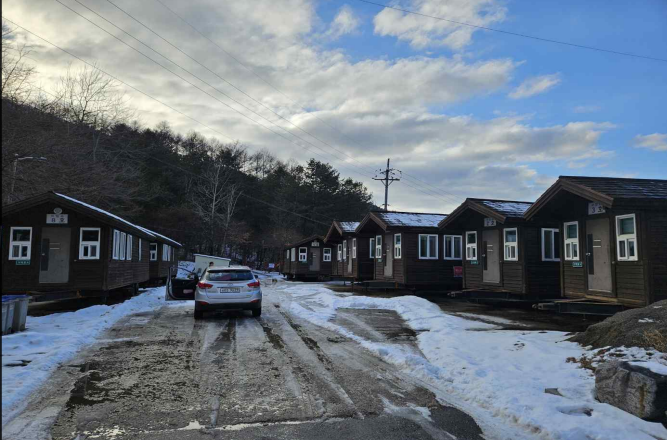
산장관광지 모빌홈 전경(보관장소)